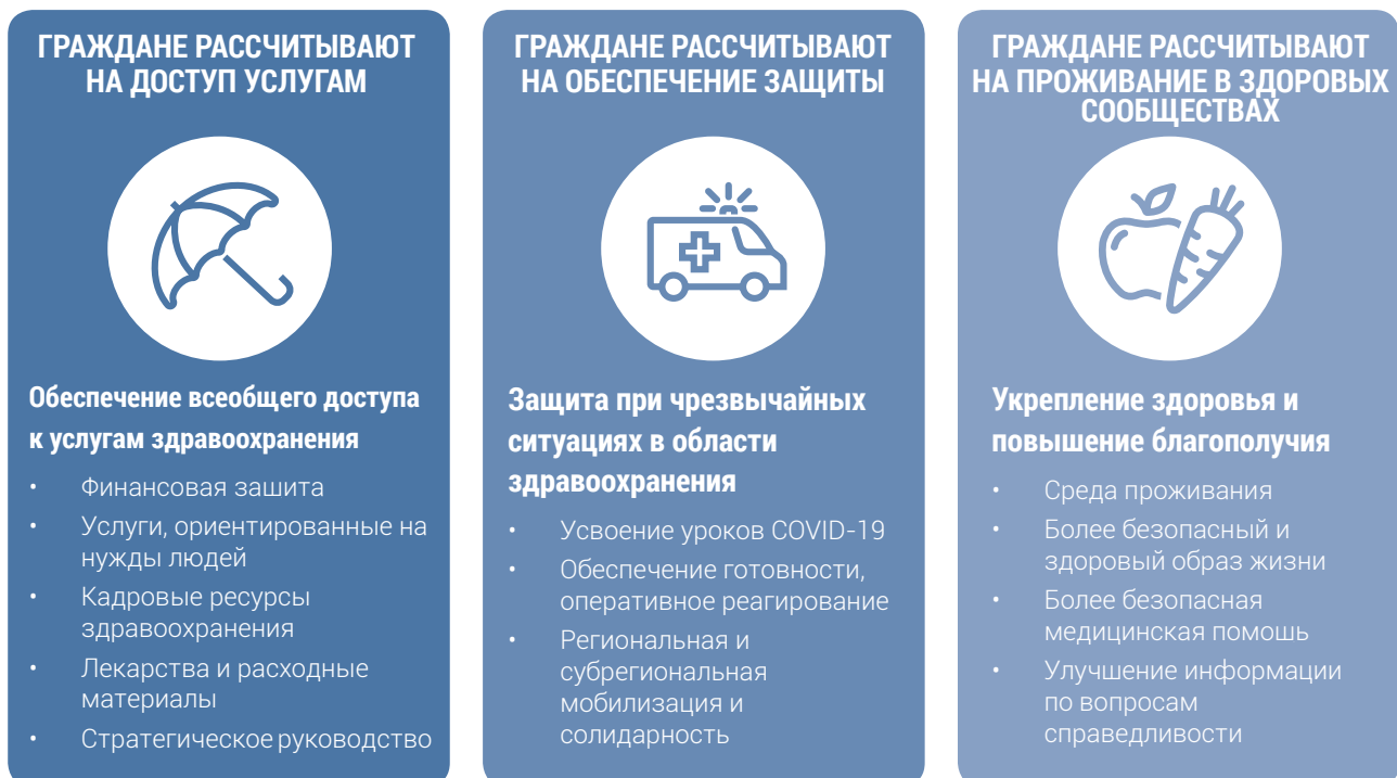
Рисунок 1. Основополагающие компоненты работы ВОЗ

Дорожная карта направлена на решение конкретных региональных задач путем целенаправленных действий и вложения ресурсов в развитие сестринского и акушерского дела на основе четырех ключевых областей (образование, предоставление услуг, рабочие места и лидерство) и 12 стратегических приоритетов ГЧНСАД с учетом национальных приоритетов здравоохранения. В ней также излагается план работы для государств-членов и Европейского регионального бюро ВОЗ на последующие пять лет по содействию реализации приоритетов ГЧНСАД и трех основополагающих компонентов ЕПР (рис. 1).